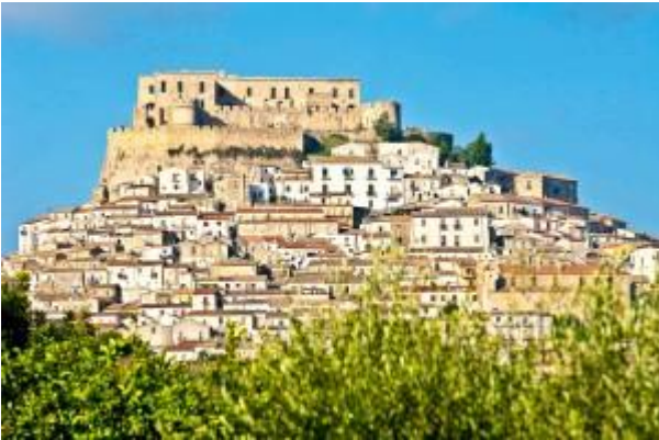
Rocca Imperiale (CZ)

Patir di Rossano. Così come del periodo svevo testimoniano le architetture del Castello di Cosenza e gli impianti federiciani delle fortezze di Rocca