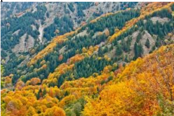
Le pendici della Sila (CZ)

E poi gli odori e i sapori di una cucina invitante, tradizionalmente povera ma ricca di aromi locali. Ovunque le testimonianze affascinanti di una cultura e una storia che parte dai Greci delle colonie oniche , passando dallo Stupor Mundi , Federico II, alla filosofia di Telesio e Campanella e al particolare misticismo di Gioacchino da Fiore , dai miracoli dei Santi Francesco, Nilo e Umile