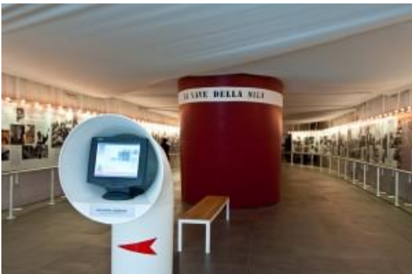
Museo dell'emigrazione. Old Calabria, Camigliatello (CS)

risalga l’altopiano si incontra la stessa successione di alberi: ulivi, limoni, carrubi della fascia più calda a cui seguono i castagni giganteschi e la vite nana, poi le querce, i pini e i faggi... “ Questa descrizione, pubblicata nel 1915 dal viaggiatore-scrittore Norman Douglas nel suo libro Old Calabria , è la dichiarazione d’amore di un viaggiatore curioso di tutto, che più di una volta percorse in buona parte a piedi le strade di Calabria. “L’inaccessibilità di questi luoghi è stata la loro salvezza” diceva allora Douglas e ancora oggi percorrendo le belle e comode strade un po’ tortuose viene da pensare