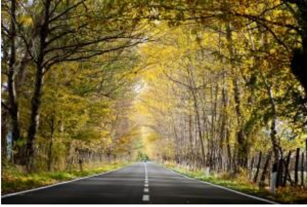
Strada di Camignatello (CZ) di autunno

boschi radi sono costellati da paesini di origine albanese , che qui furono insediati nei primi decenni del quattrocento a seguito della promessa di ospitalità che il re di Napoli, Alfonso d'Aragona, fece al condottiero albanese Giorgio Castriota Scanderbeg in cambio dell'aiuto avuto durante la guerra tra baroni e villani. Sulle pendici di Cozzo di Pesco si trova un bosco monumentale di castagni e aceri che superano gli 800 anni e i 9 metri di circonferenza, un parco di sculture naturali in cui perdersi per ore. E improvvisamente "scorsi il mare ai miei piedi: ma quale mare! Rilucente, azzurro: era un cielo