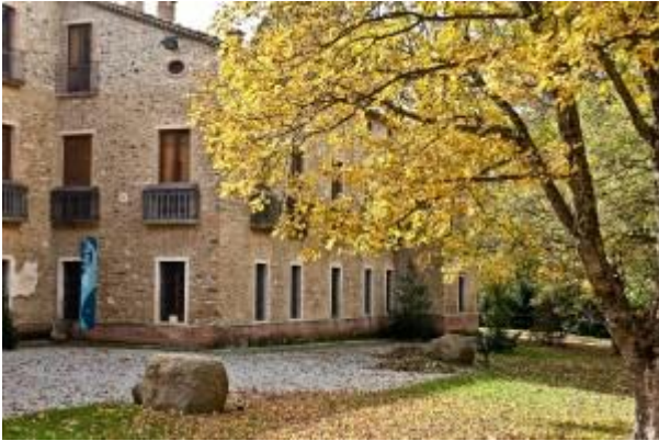
Old Calabria a Camigliatello (CS)

da Bisignano alle leggende fantastiche del tesoro del re Alarico , ancora ben nascosto negli impianti medievali dei nuclei urbani e tra le numerose tracce bizantine di chiese e palazzi. La Sila è forse la zona più conosciuta e visitata della Calabria , “un venerando altipiano granitico che già si ergeva qui quando gli orgogliosi Appennini sonnecchiavano ancora sul letto melmoso dell’Oceano – una regione dolcemente ondulata con le cime delle colline coperte di boschi e le valli coltivate e in parte adibite a pascolo... L’acqua è una delle glorie... l’aria vibrata e pungente.... Da qualunque lato si