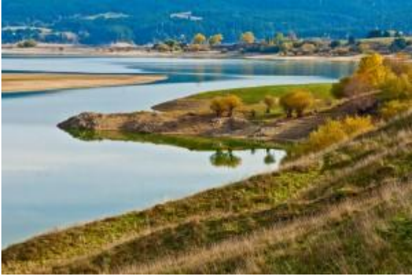
Lago di Cecita (CZ)

soprattutto a Diamante in un incrociarsi di sacro e profano, nuovo e antico.