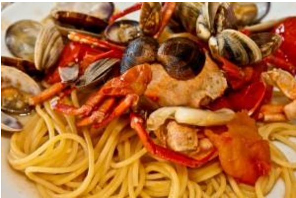
Diamante (CZ). Spaghetti con sugo di granchio

impresiositi da colori e parole mentre tra i ruderi del nucleo storico, sorto tra il 1'850 e il 1000 d.C. e abbandonato nel 1808, in un