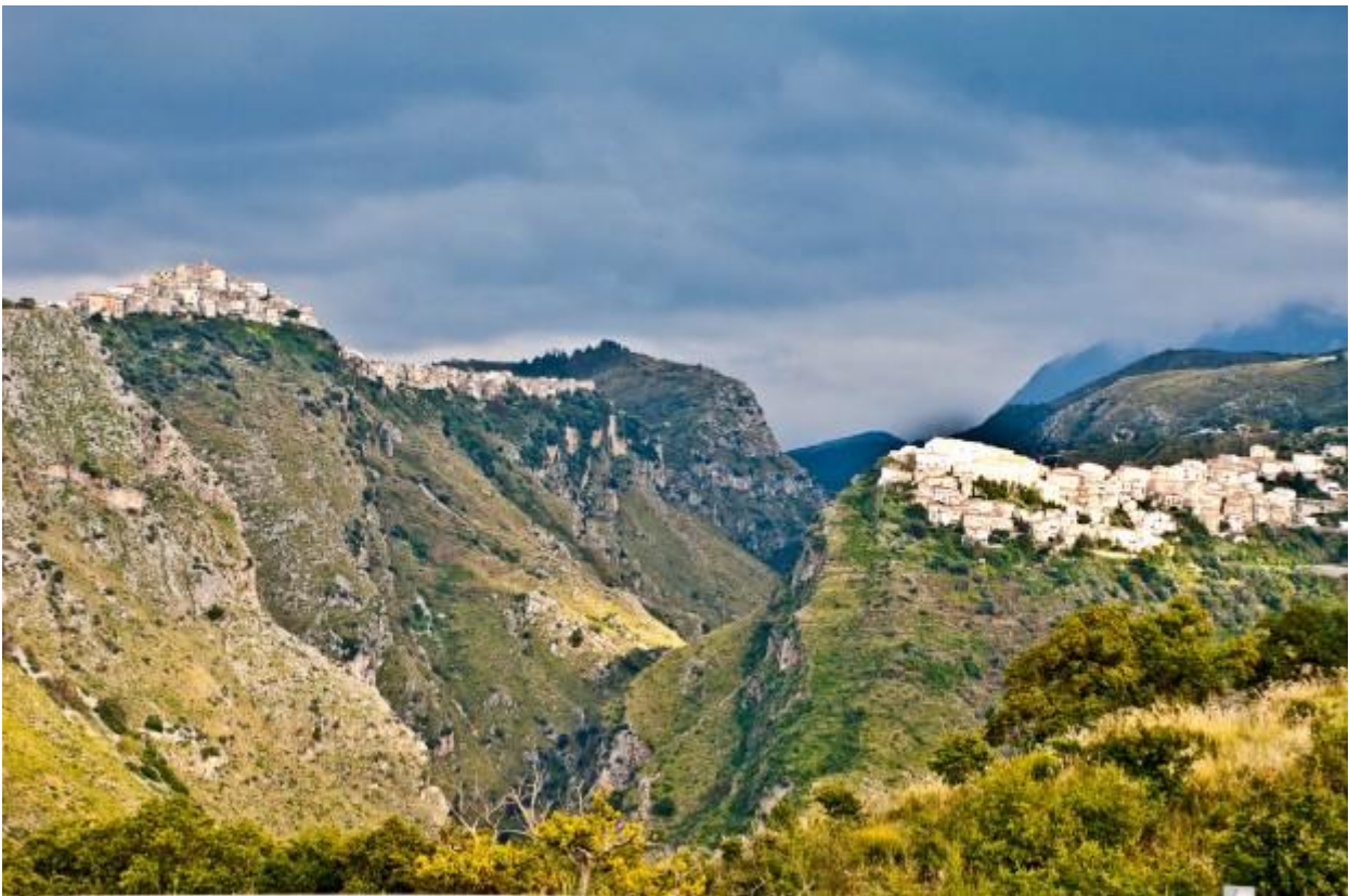
I paesi di Maierà e Grisolia (CZ)

Bagnata dallo Ionio e dal Tirreno, un Mediterraneo navigato da una civiltà millenaria, protetta da boschi e montagne, dal ruvido e maestoso Pollino alla verde e dolce Sila. Profumata dalla macchia mediterranea e dalle essenze agrumate delle coltivazioni di pianure feconde, belle da sembrare giardini.