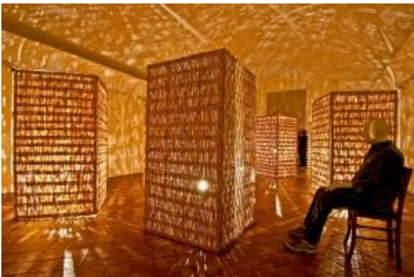
Cosenza. Palazzo Arnone:

Nell’antico Palazzo Arnone , sede della Galleria Nazionale di Cosenza , nelle sale recentemente restaurate si possono ammirare opere di Pietro Negrone , Mattia Preti e Luca Giordano insieme all’icona della Madonna del Pilerio e la Stauroteca (preziosissima croce-reliquiario donata da Federico II in occasione della riconsacrazione della Cattedrale nel 1222).