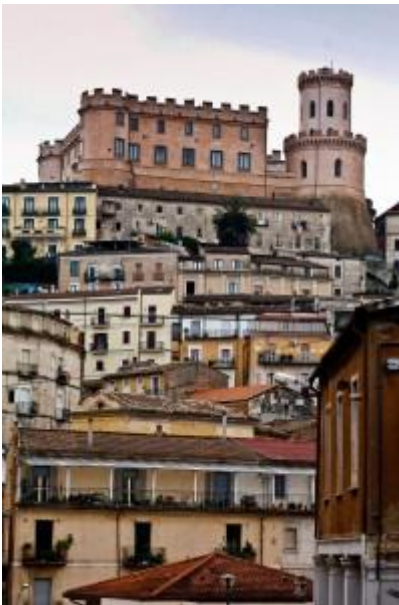
Corigliano calabro (CZ)

boschi radi sono costellati da paesini di origine albanese , che qui furono insediati nei primi decenni del quattrocento a seguito della promessa di ospitalità che il re di Napoli, Alfonso d'Aragona, fece al condottiero albanese Giorgio Castriota Scanderbeg in cambio dell'aiuto avuto durante la guerra tra baroni e villani. Sulle pendici di Cozzo di Pesco si trova un bosco monumentale di castagni e aceri che superano gli 800 anni e i 9 metri di circonferenza, un parco di sculture naturali in cui perdersi per ore. E improvvisamente "scorsi il mare ai miei piedi: ma quale mare! Rilucente, azzurro: era un cielo