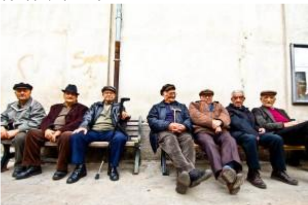
Anziani seduti su una panchina a Longobucco (CZ)

Castrum Patrae Roseti , fu innalzato dai normanni nell'XI sec e fortificato due secoli più tardi da Federico II di Svevia. In una magnifica posizione a picco sul mare la rocca, che si dice abbia ospitato la Sacra Sindone , è stata trasformata in un ristorante per cerimonie ultra romantiche. Il mare azzurro che bagna la costa di sassi neri dipinge la strada fino a Rocca Imperiale, forse tra i borghi meglio conservati . Il suggestivo abitato costruito attorno a un'altura si dispone a semicerchi concentrici fino