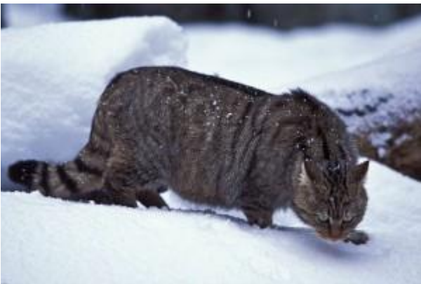
Sila (CZ). Gatto selvatico

... Ammonticchiati là come giumenti sulla gelida prua mossa dai venti, migrano a terre inospiti e lontane; laceri e macilenti, varcano i mari per cercar del pane... (Edmondo De Amicis, Gli emigranti)