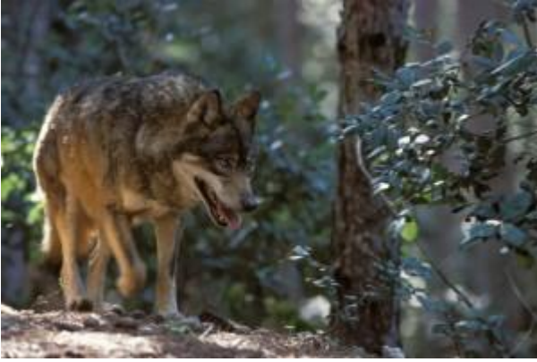
Sila (CZ). Lupo appenninico

sulla regione e tra i testi scritti dai viaggiatori di tutti i tempi. Poco distante nella “ Nave della Sila ”, il Museo Narrante dell’Emigrazione , una preziosa raccolta di fotografie, illustrazioni, copertine di vecchie riviste accompagnate dai testi di Gian Antonio Stella, poesie, testimonianze e avventure di tanti uomini, donne e bambini partiti alla ricerca del “nuovo mondo” compongono la ricostruzione del ponte di una nave.