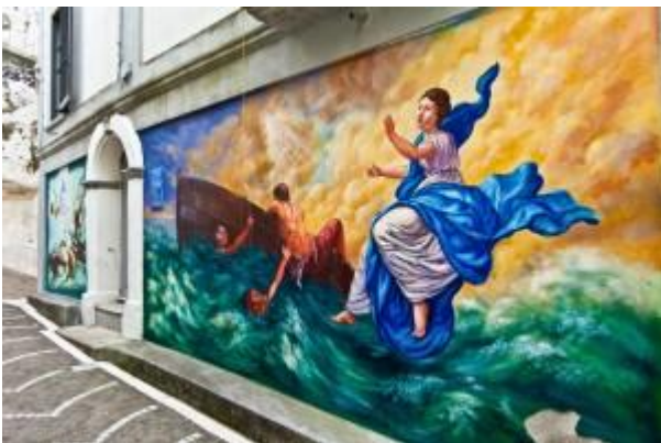
Diamante (CZ). Murales

panorama di struggente bellezza, sorge il nuovo anfiteatro. Nell'antico borgo di pescatori di pesce azzurro ogni anno a settembre si festeggia Sua Maestà il Peperoncino , un evento gastronomico e culturale di grande risonanza internazionale. Diamante è dal 1994 sede dell'Accademia Italiana del Peperoncino che conta migliaia di soci e delegazioni da Tokyo a New York, da Parigi a Sidney, per approfondire e diffondere la cultura del piccante come una filosofia di vita basata sull'anticonformismo e la trasgressione. Ma non si produce solo peperoncino (che per altro viene importato anche dalla Cina!) perché