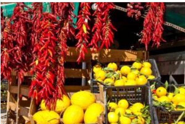
Oriolo (CZ). Peperoncini e limoni.

partenza di una di queste vie , che velocemente raggiungeva il Tirreno, alla foce del fiume Lao e l'omonima città , per poi riprendere il mare per la colonia Poseidonia (Paestum) e i porti dell'Etruria . Su questo tracciato di grande valore storico-culturale, Angelo Aligia , ha in mente un progetto ambizioso: un percorso di installazioni, opere di artisti non solo italiani, che colleghino idealmente passato e futuro della Porta dei Greci. Il lavoro di Aligia, l'artista nato a Maierà nel 1959, è sempre stato contrassegnato da un radicato legame con la propria terra. Un paesaggio contadino e ricco di storia di cui tenta di preservare e rinnovare la memoria. Il paesaggio aspro del Pollino e quello docile del Tirreno, ricco di tradizioni e sapienze antiche in cui "rigenerare materiali naturali da trasfigurare in nuovi moduli creativi, la trasformazione della materia legata all'uomo". Aligia vive a Diamante , il paese dei Murales , "inventato" da un altro artista, Nani Razzetti , pittore-sculitore-poeta, che nel 1981 ebbe l'idea di dipingere i muri delle case per rivalutare il vecchio centro storico e portare più turisti in quella che già veniva definita la "perla del tirreno" da Matilde Serao. Ora i murales sono più di 200 : momenti di vita quotidiana e storie del passato,